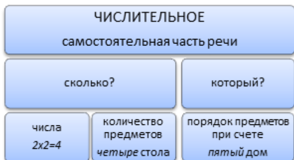
Схема 1. Числительное как часть речи

и отвечающие на вопросы сколько? , который?