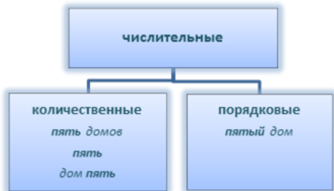
Схема 2. Разряды числительных